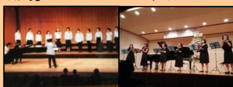
うばらハーモニー グリーンスサークル