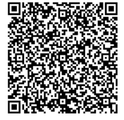
QR コード HP メール

【お願い】演奏時の撮影はご遠慮ください(※フラッシュ・アラームは禁止)。この催事は、スタッフが動画撮影を行います。 バッハ・イン・ザ・サブウェイズ 2019 実行委員会 090-2100-3258 bach.it.subways.jk@gmail.com フェイスブック https://www.facebook.com/BachInTheSubwaysJapan/